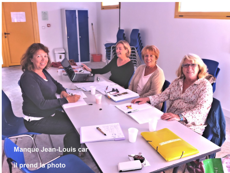
Manque Jean-Louis car il prend la photo